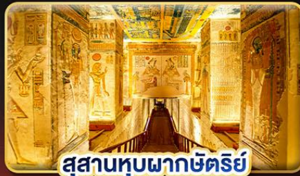
สุสานหุบผากษัตริย์