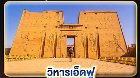
วิหารเอ็ดฟู