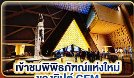
เข้าชมพิพิธภัณฑ์แห่งใหม่ ของอียิปต์ GEM